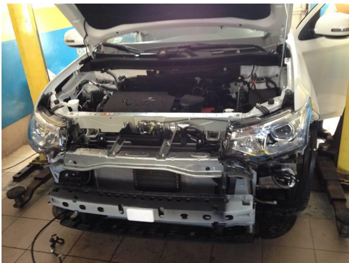
Thermo Top Evo