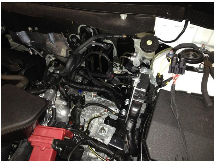
wiązka elektryczna i bezpieczniki