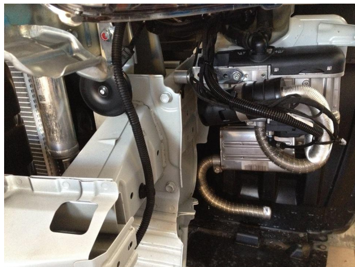
agregat i tłumik wydechu