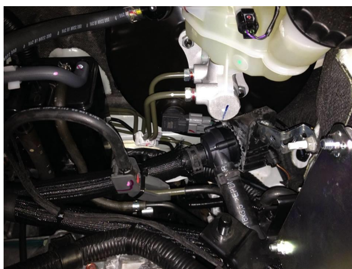
pompa obiegowa wody